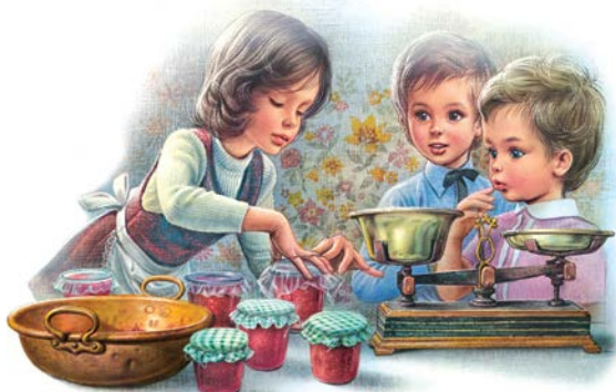
Martine fait la cuisine, 1974.

Au fil de ses 70 ans, Martine est devenue un symbole de l'enfance et de l'innocence dans un monde en mutation, offrant aux lecteurs une bulle de bonheur et d'optimisme plus bienvenu que jamais.