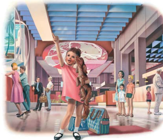
Martine en avion, 1965.

LB : Née en 1954, pendant les Trente Glorieuses, Martine vit ses premières aventures dans un monde séduit par le progrès et la joie de vivre. Loisirs, transports, vie domestique, modes de consommation : l'univers de la fillette fourmille d'inventions et de nouveautés. À partir des années 1970, Martine prend de plus en plus d'initiatives, à l'image d'une société qui libère les femmes et considère davantage les enfants comme des acteurs du quotidien. Audacieuse et de plus en plus autonome, elle multiplie les activités et a soif d'apprendre. La danse, la cuisine, la natation, la voile ou le vélo n'auront plus de secrets pour elle. Dans les années 1980 et 1990, certaines intrigues se complexifient – comme le monde – mais Martine affronte les difficultés avec aplomb. La nature acquiert également une place croissante dans l'univers de l'héroïne, au diapason d'une société de plus en plus sensibilisée aux questions environnementales. Cette problématique devient majeure dans les années 2000, où elle alterne avec une dimension plus imaginaire, le réel cédant parfois le pas à la pure fiction.