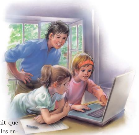
Martine protège la nature , 2009.