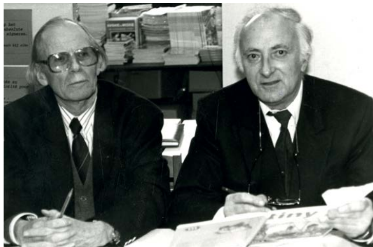
Marcel Marlier et Gilbert Delahaye, 1966.