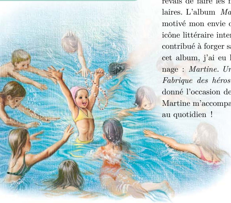
Martine apprend à nager , 1975.

LB : Martine est un personnage qui a bercé mon enfance. Comme tant d'autres jeunes lecteurs et lectrices, j'ai adoré lire et relire les histoires de cette petite fille qui me ressemblait. J'enviais sa vie, je rêvais de faire les mêmes choses qu'elle, de vivre des aventures similaires. L'album Martine apprend à nager , par exemple, a sans doute motivé mon envie d'apprendre à maîtriser la brasse. Martine est une icône littéraire intemporelle et j'ai voulu m'interroger sur ce qui avait contribué à forger sa pérennité et son succès transgénérationnel. Avant cet album, j'ai eu la chance de publier un essai consacré au personnage : Martine. Une aventurière du quotidien dans la collection « La Fabrique des héros » aux Impressions nouvelles (2021), ce qui m'a donné l'occasion de me pencher une première fois sur cette question. Martine m'accompagne maintenant depuis plus de quatre ans, presque au quotidien !