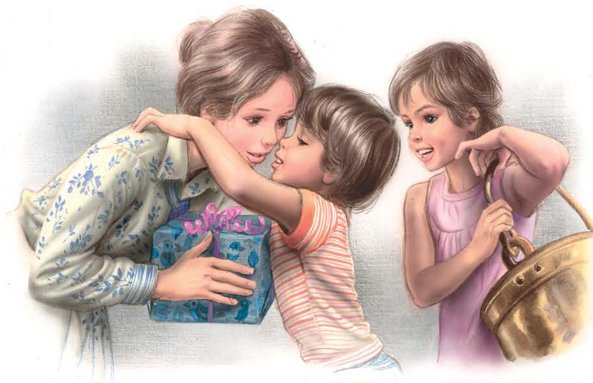
Martine fête maman, 1982.

Leur programme est disponible sur le site www.centremarcelmarlier.be