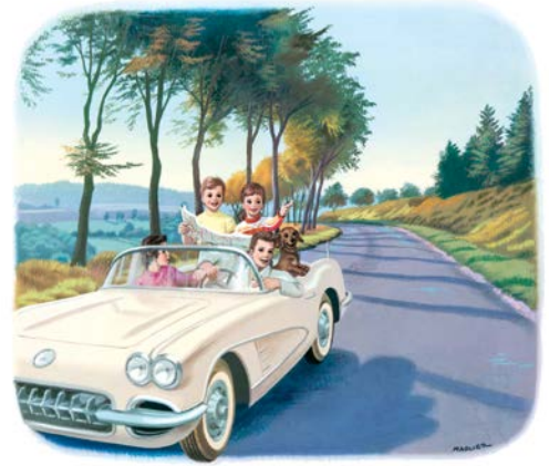
Martine fait du camping, 1960.

Dans les années 1950, la littérature de jeunesse est en plein renouveau et reflète les changements sociaux et culturels de l'époque. Avec la fin de la Seconde Guerre mondiale, les auteurs et éditeurs se tournent vers des récits plus optimistes et imaginatifs, offrant aux enfants des histoires qui les transportent dans des mondes enchantés. Les thèmes de l'aventure, de l'amitié et de la découverte sont au cœur de nombreux livres pour enfants, offrant aux jeunes lecteurs des échappatoires bienvenues et des occasions d'explorer de nouveaux horizons. C'est dans ce contexte que Martine voit le jour en 1954, lorsque les éditions Casterman demandent à deux de leurs collaborateurs, Gilbert Delahaye, auteur et typographe, et Marcel Marlier, illustrateur, d'imaginer une héroïne féminine pour les 5 à 8 ans.